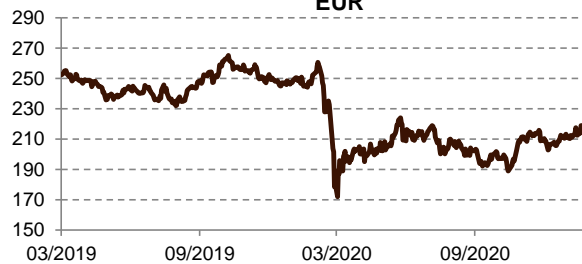
STOXX Europe 600 Telecommunications Price EUR